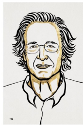
Ill. Niklas Elmehed © Nobel Prize Outreach Pierre Agostini Prize share: 1/3