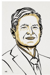
Ill. Niklas Elmehed © Nobel Prize Outreach Ferenc Krausz Prize share: 1/3