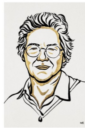
Anne L'Huilier Prize share: 1/3